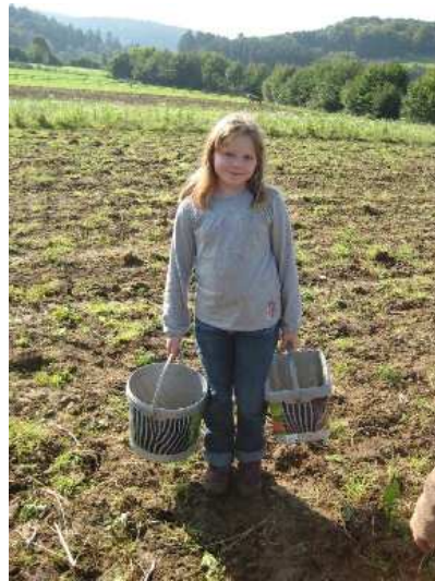
... die besten Kartoffeln prämiert...